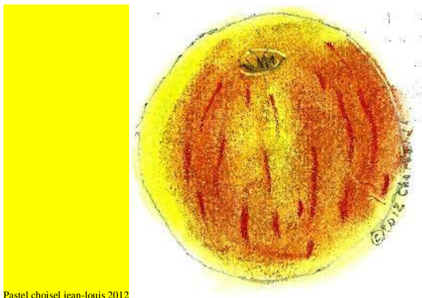
Pastel choisel jean-louis 2012